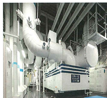
センタープラント

当支部の管轄エリアである当地域の知識、理解を深めるための見学会となっています。施設の性質上、人数の制限がございますので、お早めにお申し込み下さい。