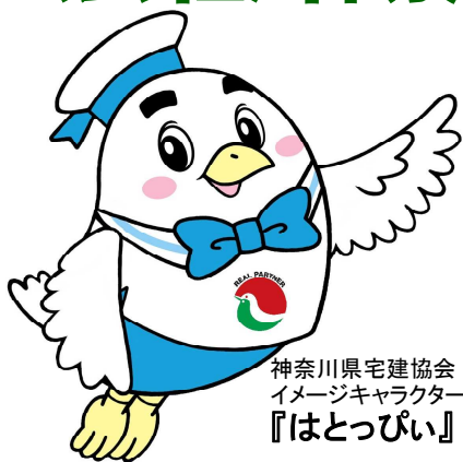
神奈川県宅建協会 イメージキャラクター 『はとっぴい』