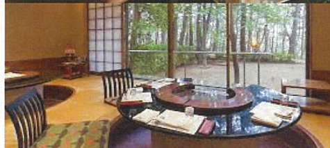
料亭旅館 山口楼 (イメージ)