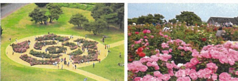
ひたち海浜公園 (イメージ)