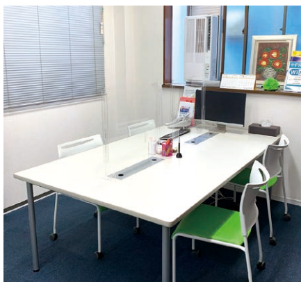
明るい雰囲気ミーティングスペース