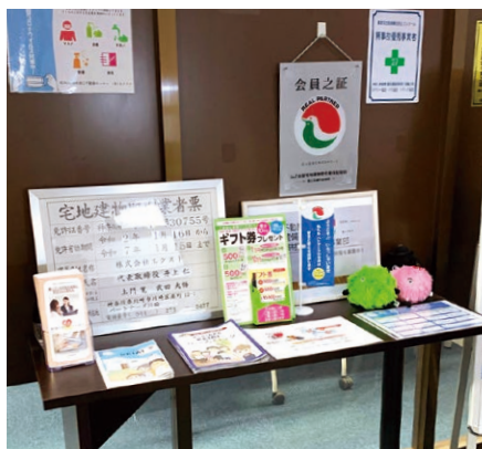
業者票やパンフレット類が見やすく掲示された入口