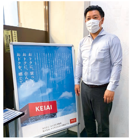
ケイアイスター不動産のフランチャイズ店として、不動産事業部をスタート

そんな株式会社エクスト様の今までの実績に、ケイアイスター不動産の力が加わり、より一層の事業拡大を図っていくことでしょう。