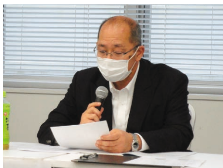
議長の武市副支部長