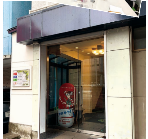
いろいろな事業部が入る社屋エントランス