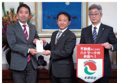
鎌倉市緑地保全基金：94,700円