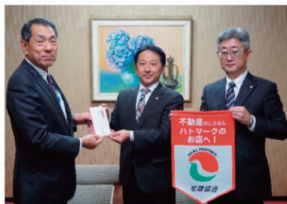
逗子市みどり基金：57,700円