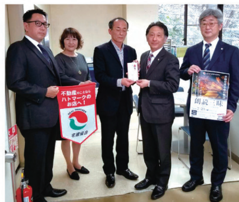
社会福祉法人 葉山町社会福祉協議会：126,796円