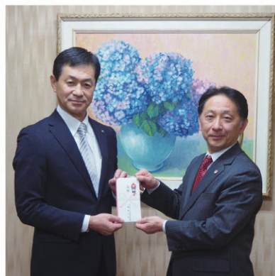
逗子しみどり基金：43,200円