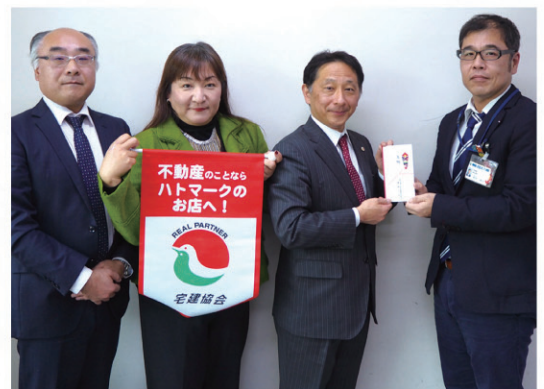
ふるさと葉山みどり基金：43,200円