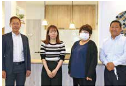
アサノスタッフのみなさん

こともあるかと思えます。ただそれであきらめるのではなく、幅広い年代の方に広めて積極的に取り組んでいくことが急務です。湘南中支部としても研修・広報でPRしていきます。ごら会員の一助となるように事業活動をさせていただきます。コロナがきっかけになってしまいましたが、業務のIT化の準備をすすめていきましょう。」