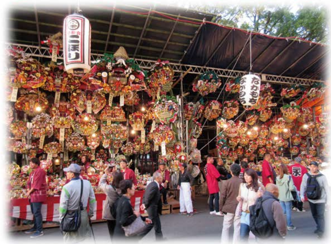
金刀比羅大鷲神社 西の市