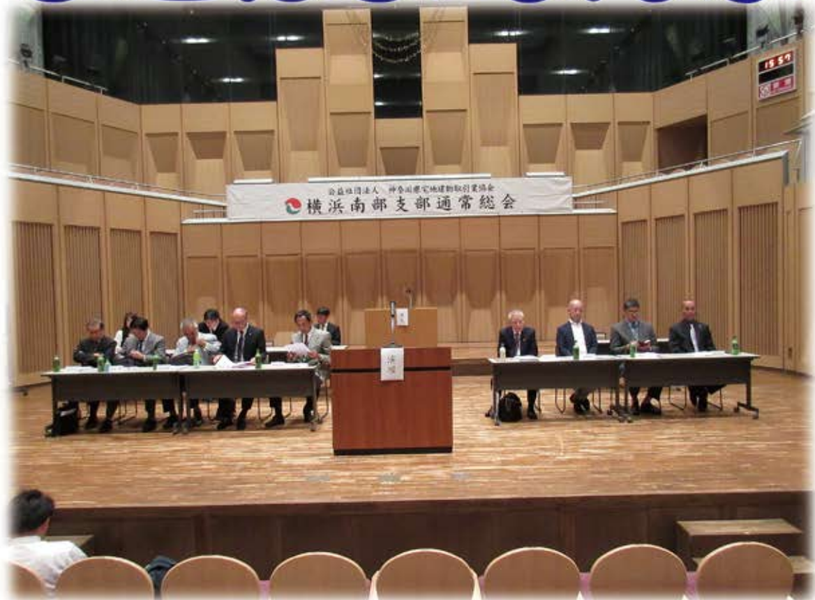
平成30年度通常総会