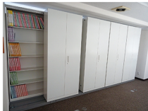
書庫内スライドキャビネット

書庫には、支部で保管すべき書類のほか、イベント等で使用する啓発グッズなどを保管しています。催しの際は机やいすを取納することにより、会議室の収容人数をアップすることもできます。