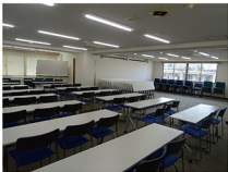
パーテーションをはずした全景